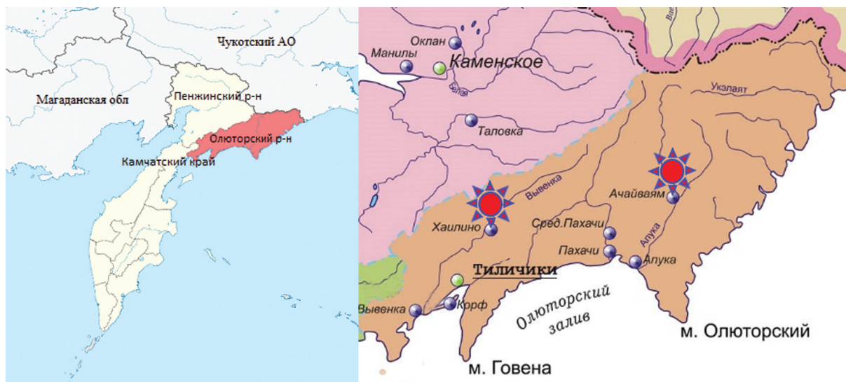
Рисунок 1. Олюторский район на карте Камчатского края и географическое положение обследованных поселений с преобладанием чукчей